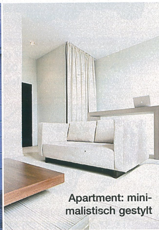
Apartment: mini- malistisch gestylt

Fünf Gründe, warum das Lux 11 das hippest Boardinghouse Berlins ist: 1. Kosmetik von La Botega dell'Albergo in den Bädern 2. die Lage in Berlin-Mitte 3. der edle Ulf Haines Store im Haus mit Mode u. a. von Dirk Schönberger 4. die Schlüsselkarte, die einem die Tür zu angesagten Clubs wie z. B. „Sage“ oder „90“ öffnet 5. die Preise: Apartment ab ca. 115 €. Infos: www.lux-eleven.com